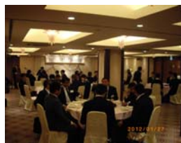
【第2部懇親会(心斎橋大成閣にて)】